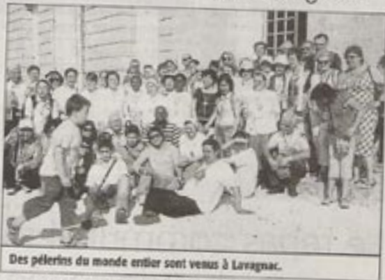
Des pèlerins du monde entier sont venus à Lavagnac.