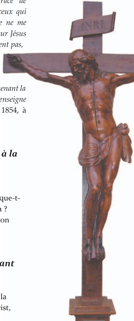
Crucifix du P. Emmanuel d'Alzon