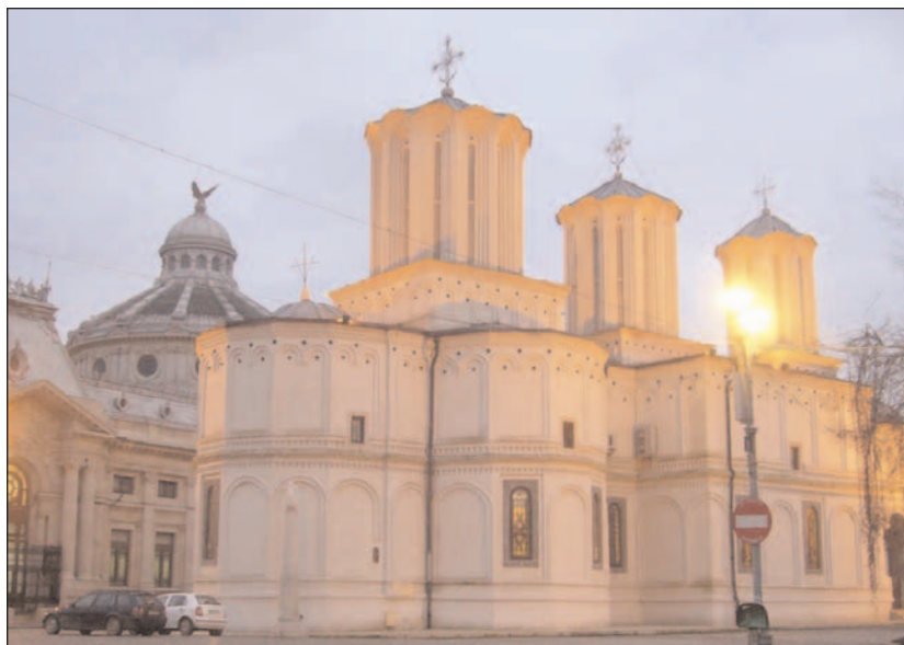
Le siège du patriarcat orthodoxe de Roumanie.