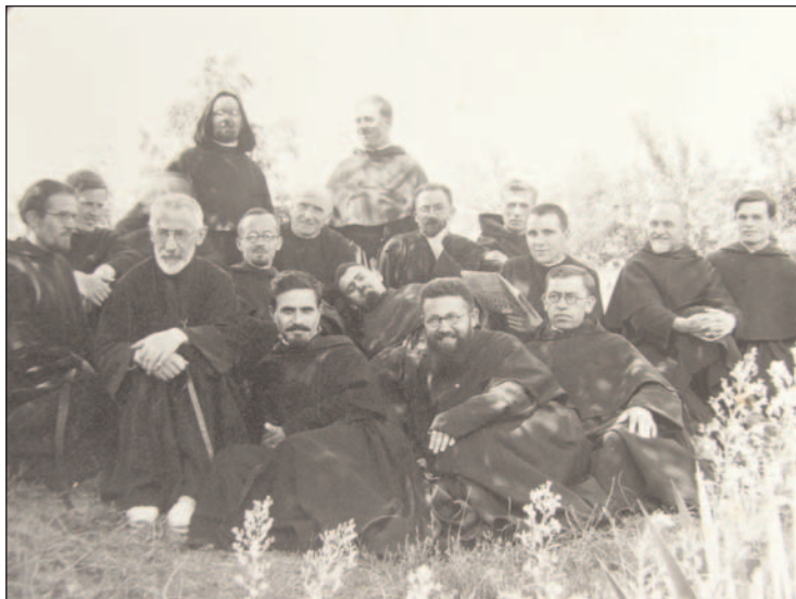
Réunion d'Assomptionnistes de Roumanie à Blaj (1943 ?)