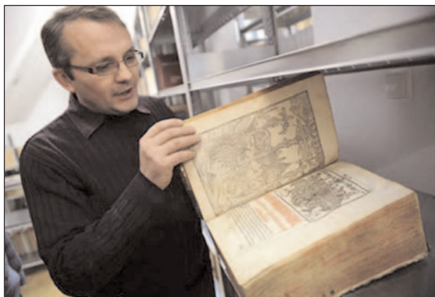
L'Euchologe de Kiev (1643)

LES ÉTUDES BYZANTINES À L'ASSOMPTION SONT UNE TRADITION INSCRITE DANS LES GÈNES. LES PIONNIERS QUE FURENT LES PP. SALAVILLE, JUGIE, DARROUZÈS, PETIT, LAURENT, FONDATEURS DE L'INSTITUT D'ÉTUDES BYZANTINES DE CONSTANTINOPLE, DES ÉCHOS D'ORIENT PUIS DE LA REVUE DES ÉTUDES BYZANTINES, NOUS ONT LAISSÉ EN HÉRITAGE UN INTÉRÊT POUR LA DÉCOUVERTE DE L'“AUTRE” TRADITION CHRÉTIENNE ET LE DÉSIR DE VOIR L'ÉGLISE RESPIRER AVEC LES DEUX POUMONS DU CHRISTIANISME, COMME LE DISAIT JEAN-PAUL II.