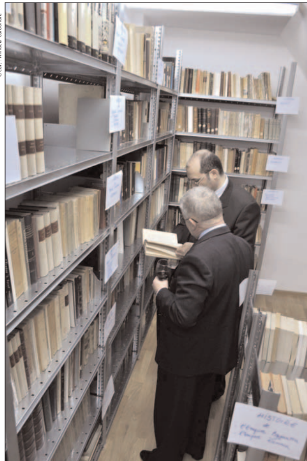
Des visiteurs intéressés.