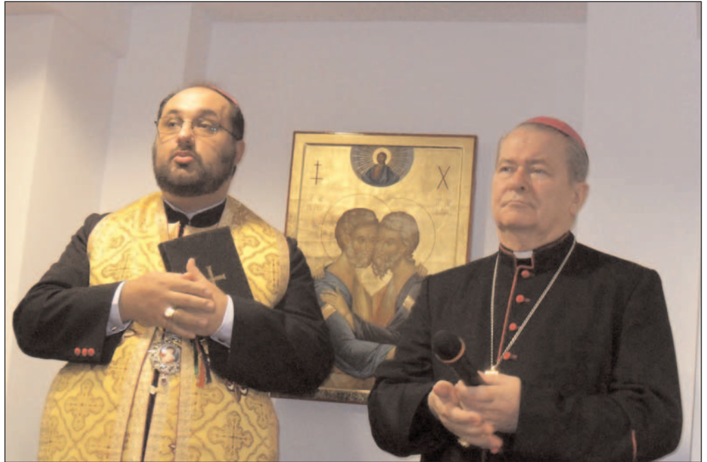
L'onction de l'icône par les deux évêques catholiques.