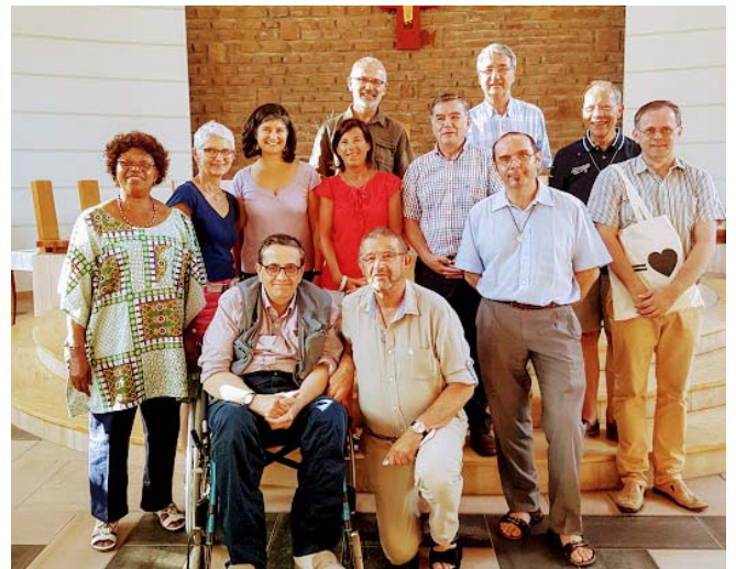
Laicos y religiosos